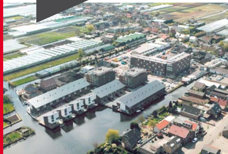
Waterryck te Roelofarendsveen

‘Heembouw haalt op alle punten een bovengemiddelde score; de bewoners van de woningen geven gemiddeld meer dan een 8’.