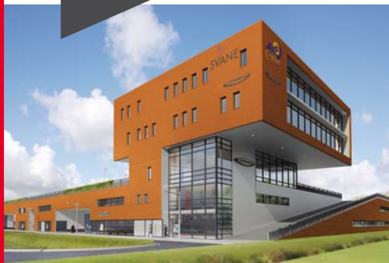
Bedrijvencentrum B2B-Oudeland te Berkel en Rodenrijs, Gemeente Lansingerland

‘Heembouw Ontwikkeling laat zien dat bedrijfscombinatiegebouwen ook mooi kunnen zijn en passen in de omgeving; dat is het resultaat van de goede samenwerking tussen de verschillende onderdelen van Heembouw Groep’.